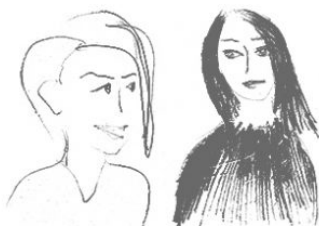
Drawing by Chikara Matsumoto

寺田倉庫アート事業の立ち上げを行った2人の女性によるアートプロジェクト運営デュオ。アートプロジェクトのディレクション、プラン策定、作家や作品の選定、コンサルティングを（主に）企業向けに行う。主なプロジェクトは、寺田倉庫株式会社アート事業、スパイラル／株式会社ワコールアートセンター（TOKYO ART FLOW 00、蒐集衆商、スパイラルアートラウンジ他）、RIMOWA JAPAN株式会社銀座旗艦店オープンアートイベント、文化庁アートサミット事務局、株式会社ピーオーリアルエステート（POLA）アートスタジオ企画、羽田天空橋エリア水辺活性化イベント実行委員会（大田区新たな水辺のにぎわい創出関連事業）、桶田コレクション展覧会、WOW inc.とのアートミュージアムの制作など。